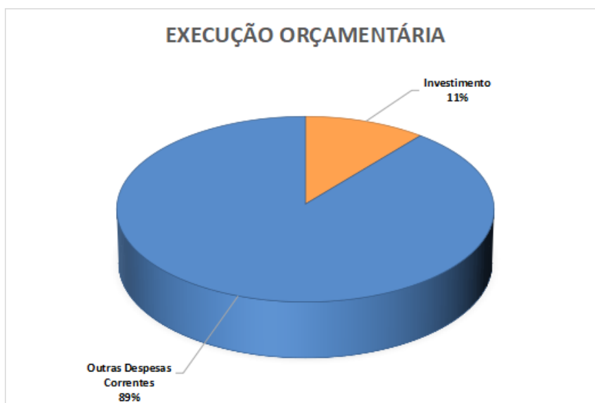
Gráfico 1 - Execução Total da Despesa – Exercício 2021