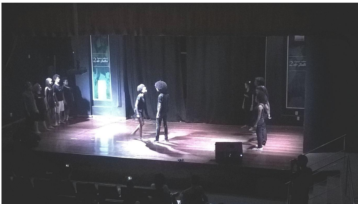
Rabiscos revelados (Santo Amaro)