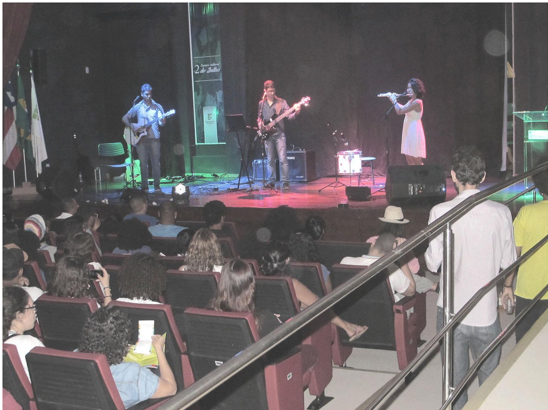
Em uma linha não se resume Bahia (Seabra)