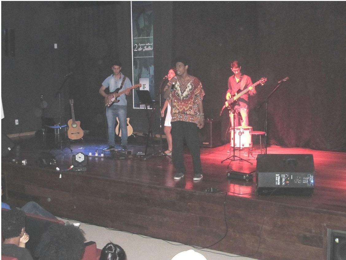
Então como eu ia dizendo... (Seabra)