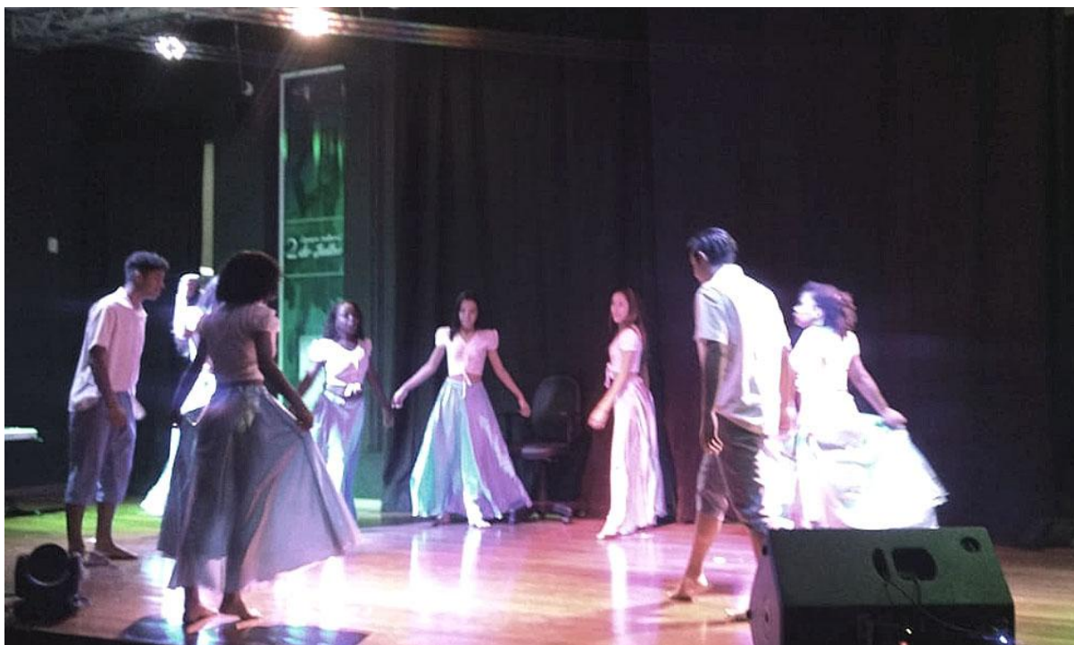
As lendas do Velho Chico: O rio e os seus mistérios (Juazeiro)