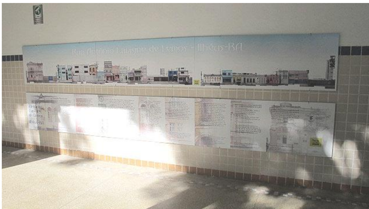
Nossa Cidade Nossa Casa (Ilhéus)