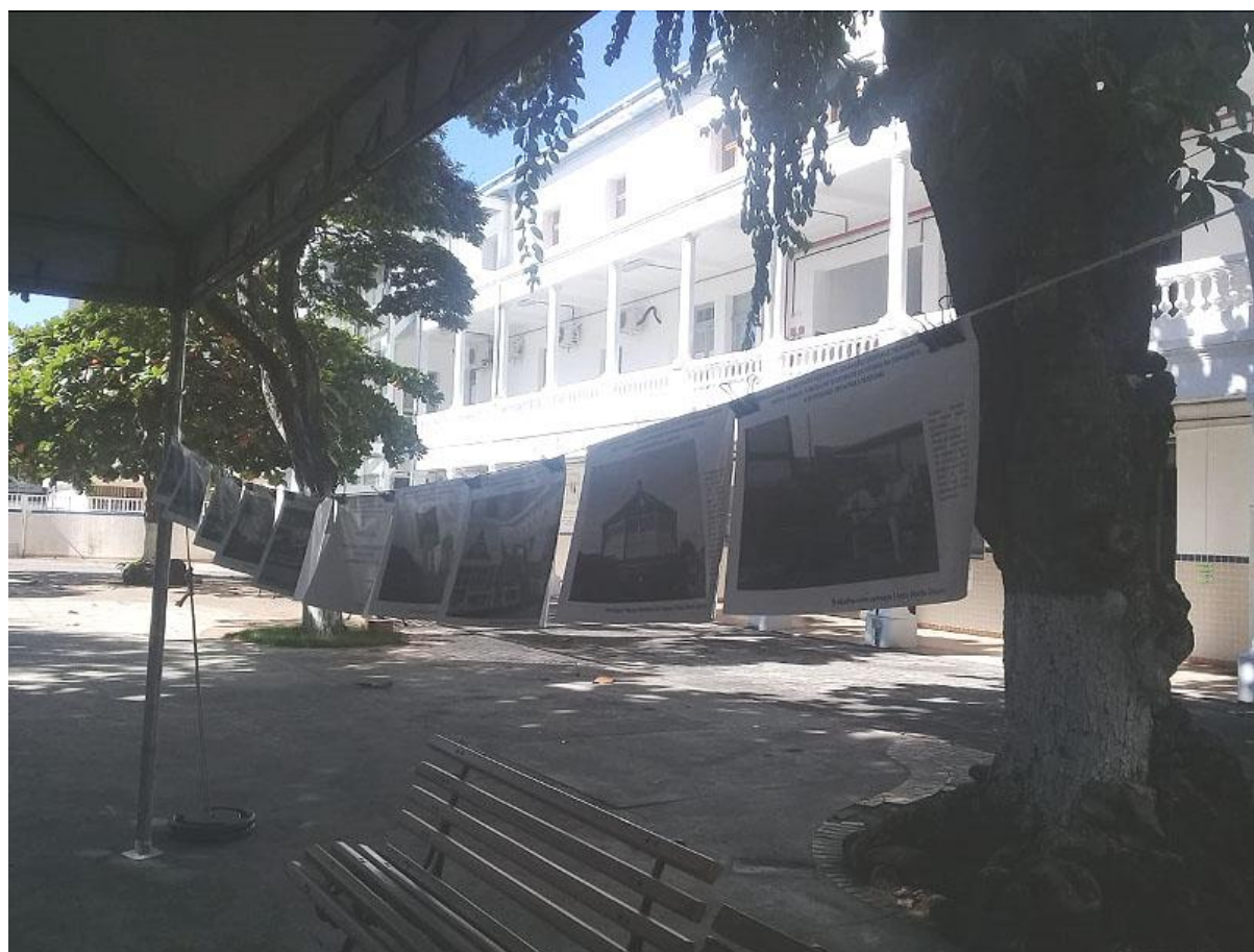
Preto e Branco, a Beleza da Identidade de Vitória da Conquista: A Diversidade Artística e Cultural (Vitória da Conquista)