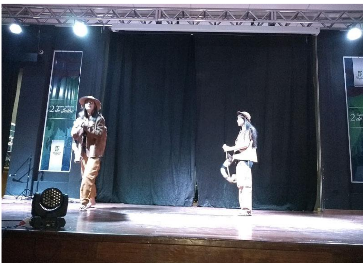
Bahia também é cangaço (Irecê)