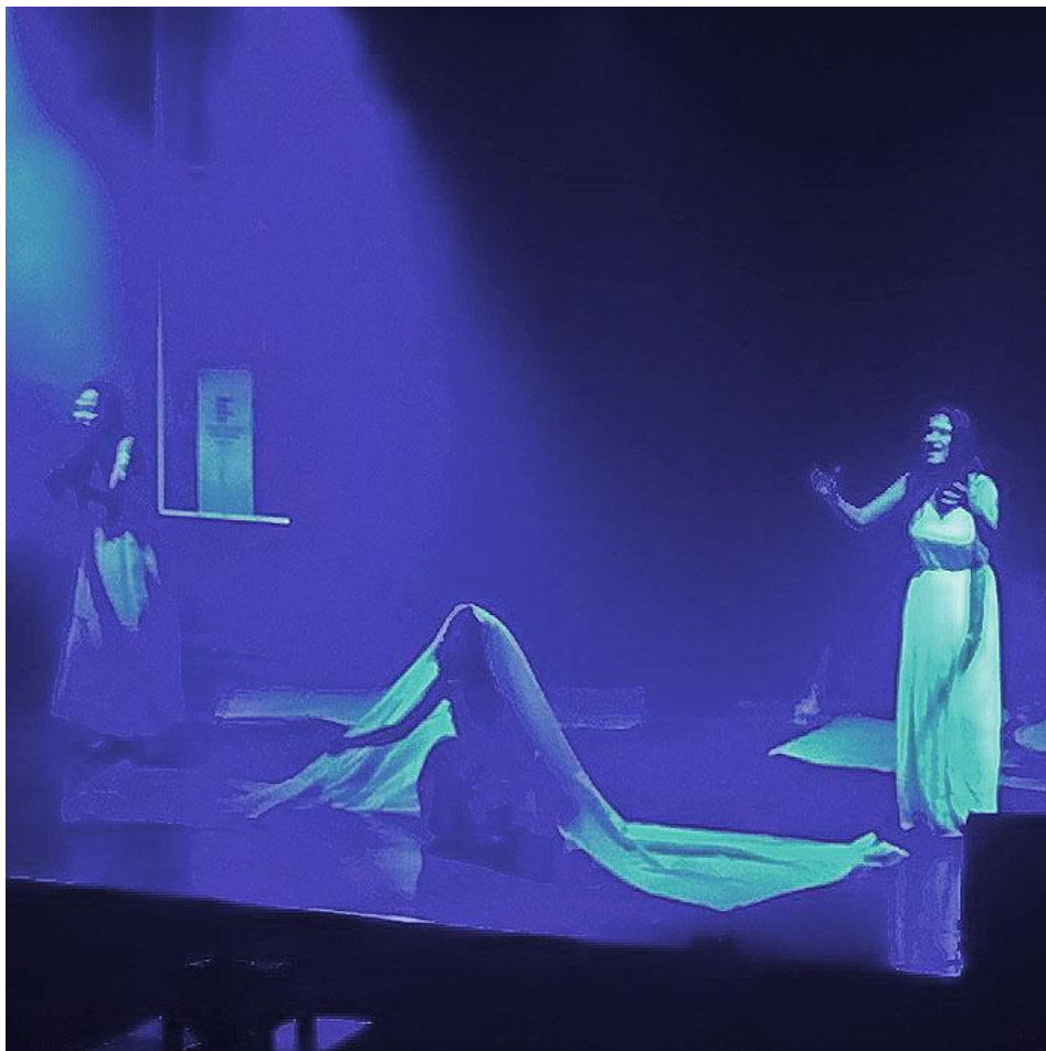
Prosápia, às heroínas do Congo (Irecê)