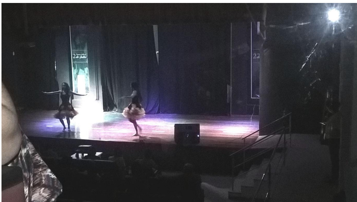
História do feijão em Irecê: cantos e versus (Irecê)