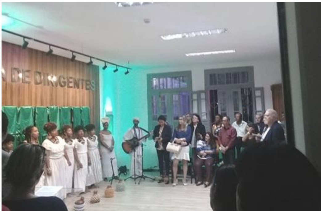
Inauguração da Galeria de Ex-dirigentes do IFBA