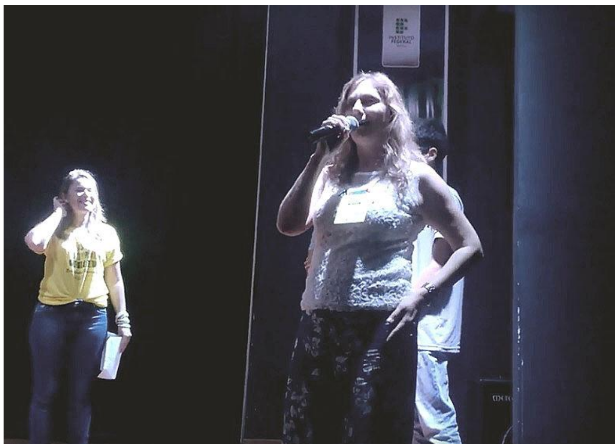
Projeto cine-humanidades: estética, subjetividades, cinema e audiovisual (Barreiras)