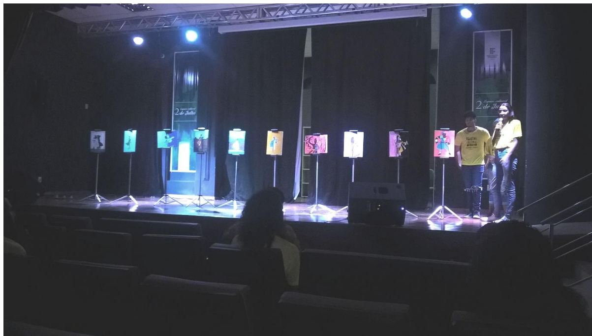
Carinha de um apartamento do outro (Valença)