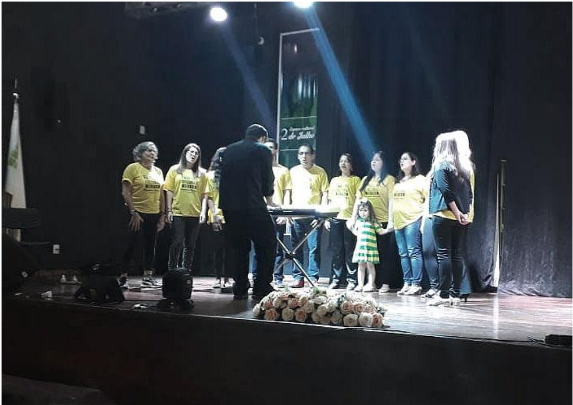
Coral do IFBA (Salvador)