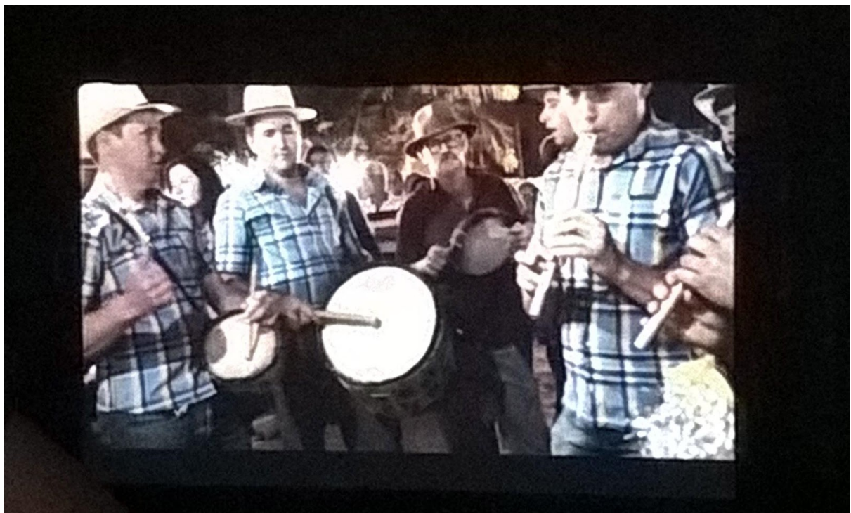
Reisado na Bahia pelo olhar da Comunidade da Lagoa de Jurema (Brumado)