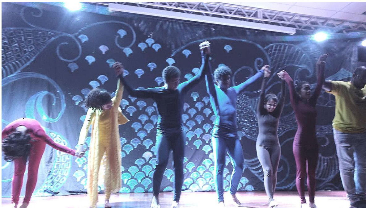
Aquário cênico (Barreiras)