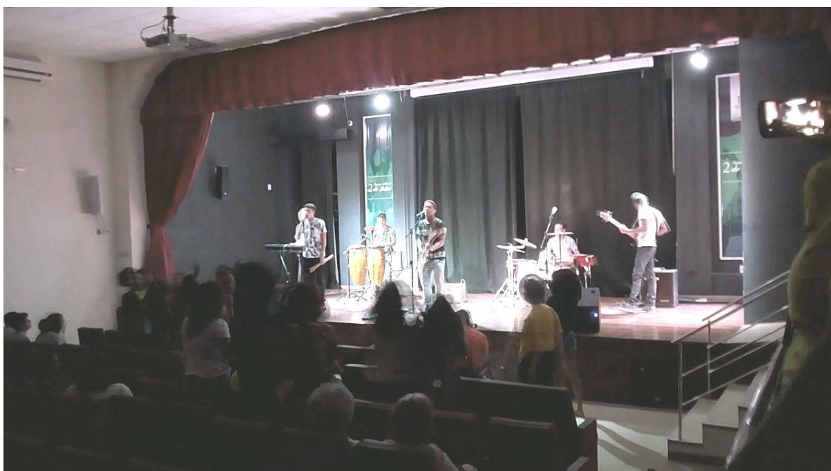
Oxe, que zuada é essa (Ilhéus)