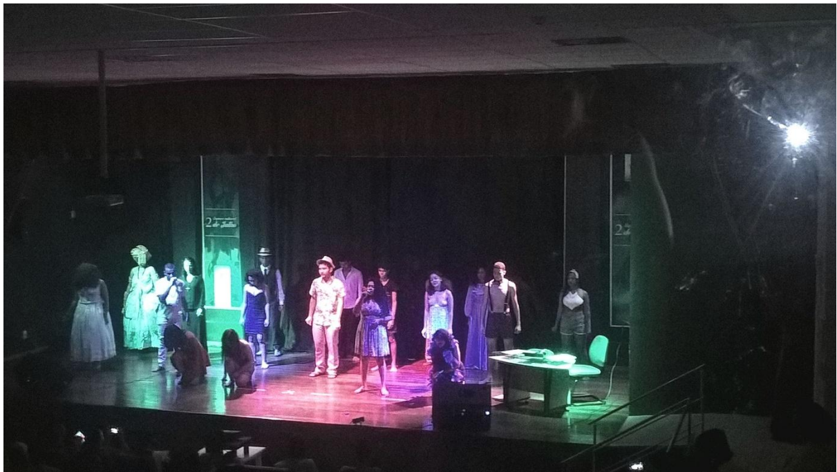
As Mulheres de Jorge (Eunápolis)