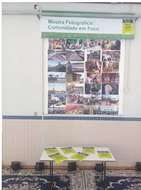
Comunidade em Foco (PROEX)