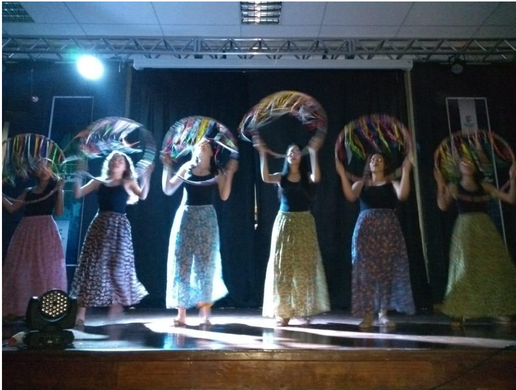
Celebrando a pluralidade (Irecê)