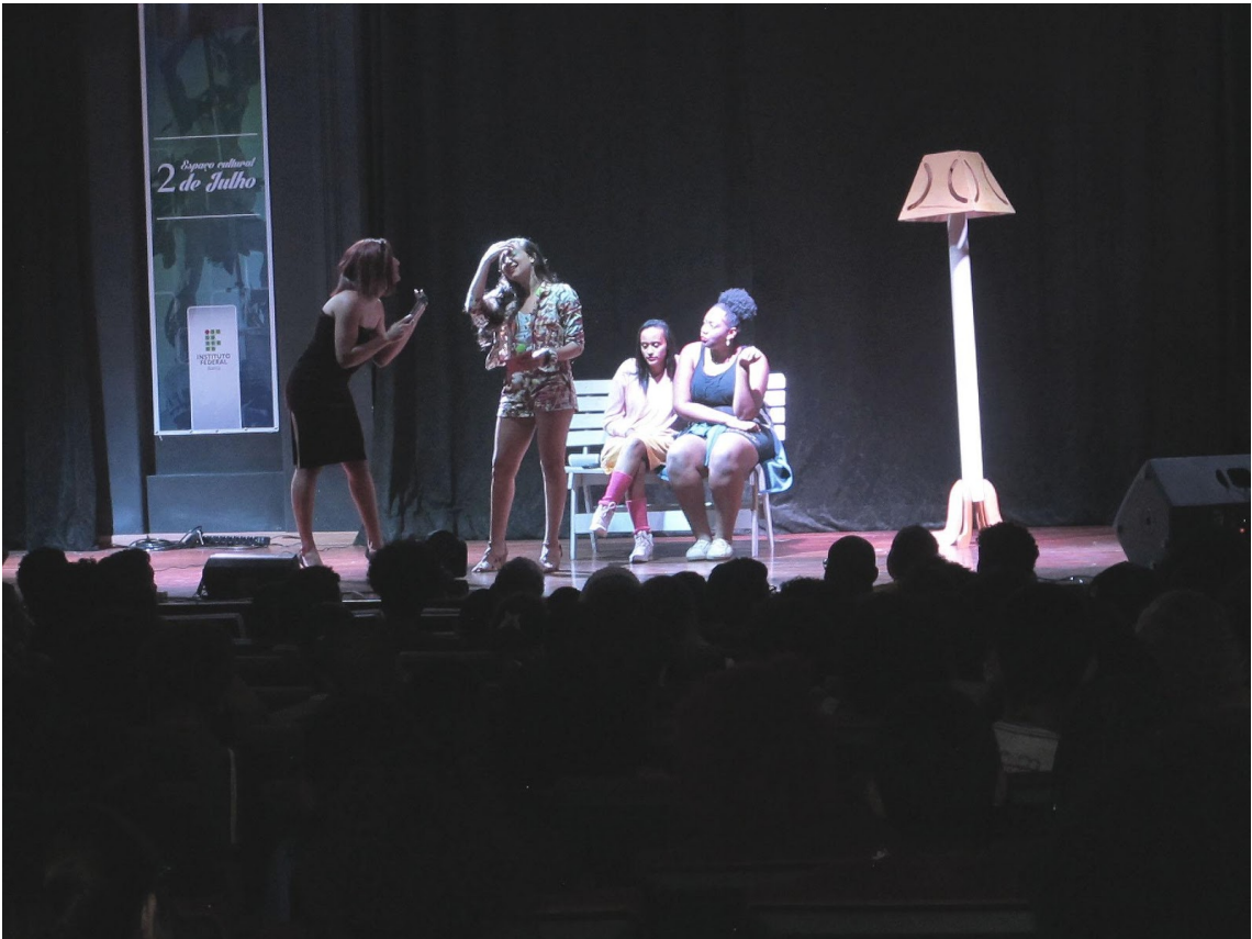
Espectáculo puro amor (Santo Amaro)