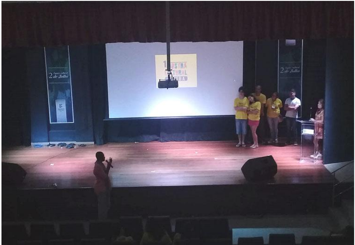
Santo Amaro em foco (Santo Amaro)