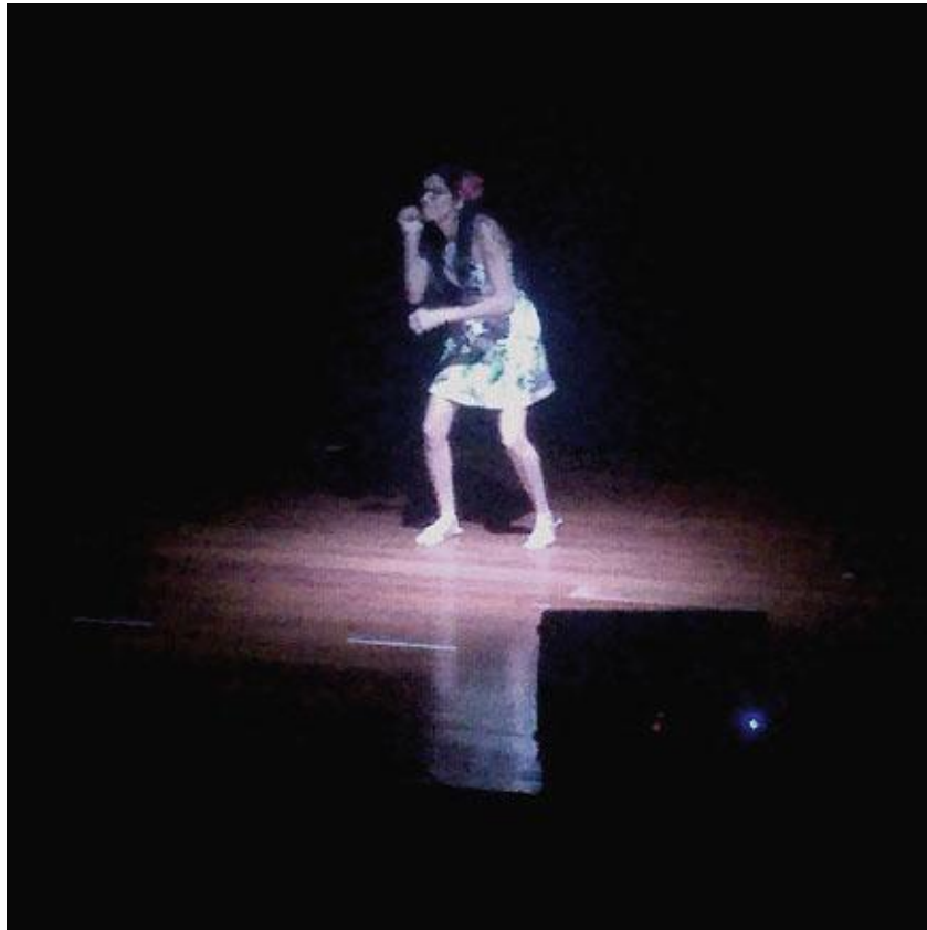
Mãos que cantam (Brumado)