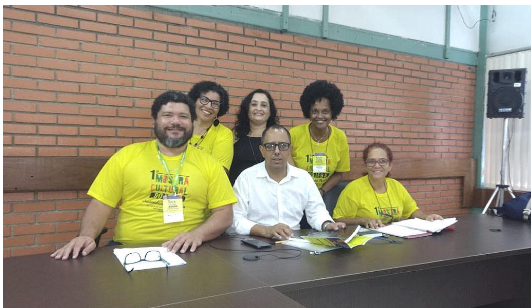
Reunião para formação da Comissão para Elaboração do Plano de Cultura /IFBA