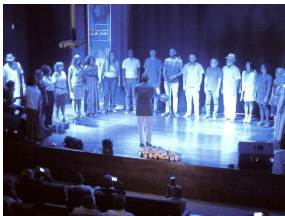
Coral do IFBA e Coral Madrigal (Vitória da Conquista)