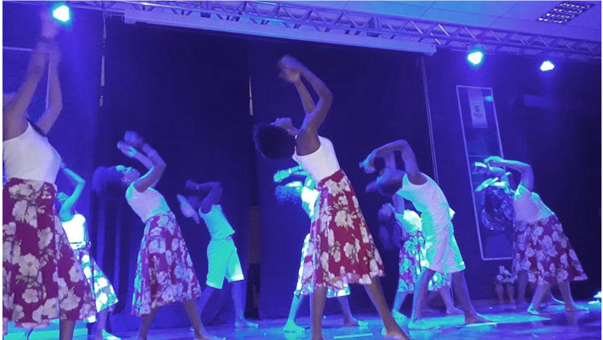
Vem pra cá, vem sambar (Santo Amaro)