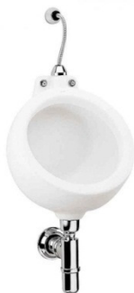
Mictório com sifão integrado.

Após a colocação do mictório, deverá ser verificado o funcionamento da instalação. Uso de mão de obra habilitada. A instalação de mictório de louça branca compreenderá a sua fixação na parede com uso de buchas plásticas e parafusos de fixação cromados, e, então, ligado às redes de água e esgoto, com uso de kit para mictório. Para uma melhor vedação deve-se utilizar fita veda rosca, nas conexões.