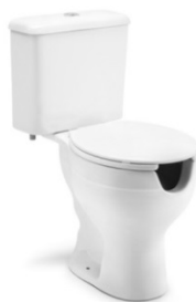
Vaso com caixa acoplada de louça branca para PcD.