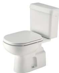
Vaso com caixa acoplada de louça branca para uso convencional.

Bacia sanitária com caixa acoplada VDR, com assento plástico (ver imagem abaixo). Consumo de até 6 L/descarga, cor branca, com assento plástico e tampas compatíveis com o conjunto, em conformidade com as NBR's 15097-1-2/11 e 15491; caixa com marcação de linha d'água para regulagem de boia.