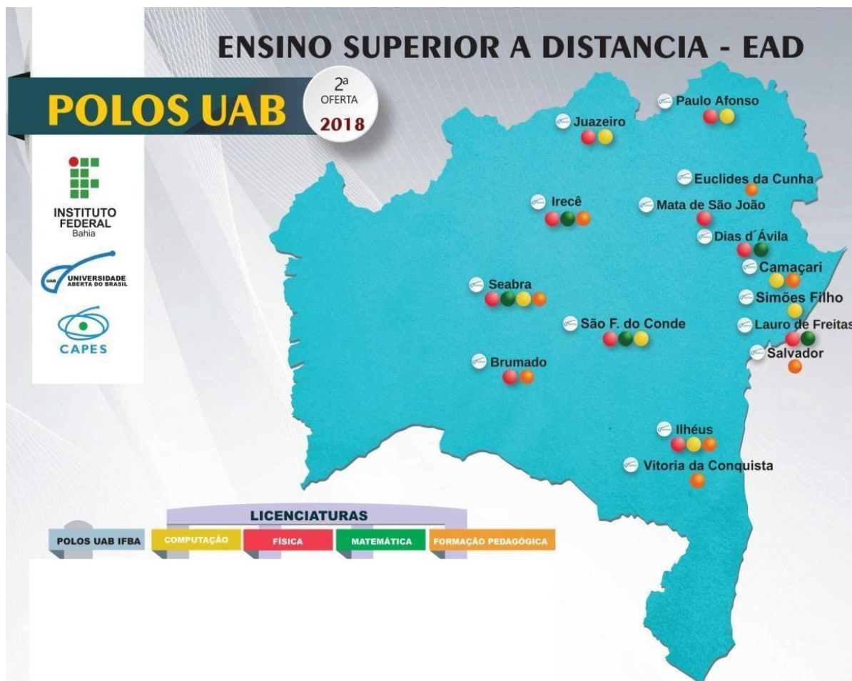
Figura 2: Cursos ofertados pelo IFBA-UAB em 2018

A Figura 3, nos apresenta um panorama de um terceiro momento da oferta de cursos EAD no IFBA (2018). Naquele momento eram oferecidos simultaneamente cinco licenciaturas (Computação, Física, Matemática, Formação Pedagógica e Educação Física), um curso de bacharelado (em administração pública), um curso de tecnólogo (em Jogos digitais) e três pós-graduações (Ensino de Matemática, Ensino de Ciências e Estudos Etnico-raciais). Nessa ocasião, a EAD atendia a 33 cidades do estado da Bahia.