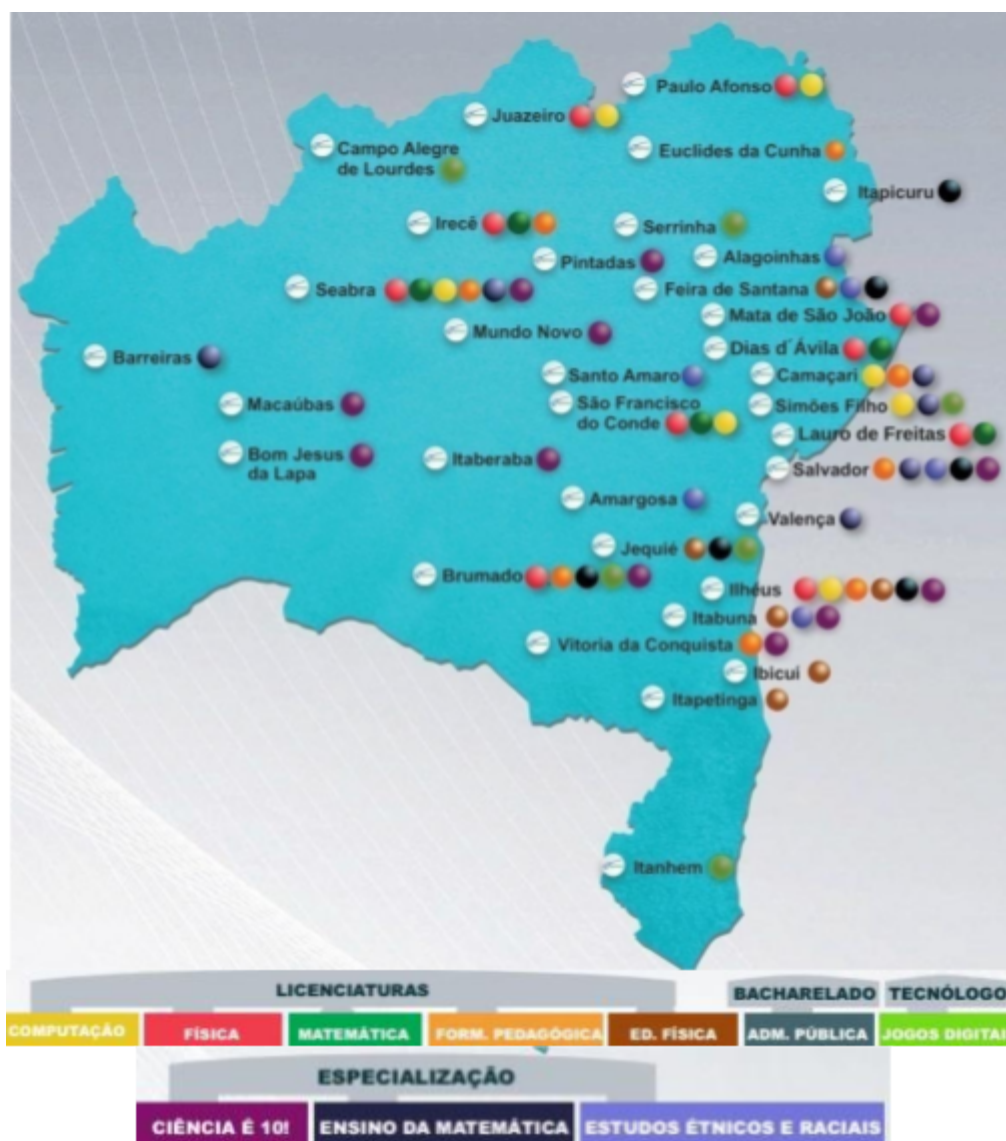
Figura 3: Todas as Ofertas IFBA-UAB

O PDI-IFBA para o quadriênio 2020-2024 estabelece as metas para a EAD a serem implementadas ao longo do período, a saber: 1) Estruturar o funcionamento da Diretoria de Educação a Distância do IFBA até primeiro semestre 2020; 2) Promover metodologia híbrida de 30% dos cursos existentes, reformulando os PPCs até 2024; 3) Garantir a formação dos servidores para utilização das ferramentas da EAD, por meio da oferta de 02 cursos/oficinas por ano, até 2024; 4) Estruturar os Núcleos/Coordenações/Diretorias de Educação a Distância nos campi até 2024; 5) Implantar pelo menos um curso na modalidade a distância com oferta própria em