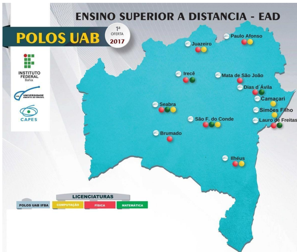
Figura 1: Cursos ofertados pelo IFBA-UAB em 2017

Na Figura 2, apresenta-se o que chamou-se de segunda oferta dos cursos superiores a distância do IFBA. Em 2018, além das três licenciaturas existentes desde 2017, o Instituto ofertou o curso de formação pedagógica. Esse novo curso também tem grande importância para o IFBA uma vez que uma parte das vagas atendeu servidores cuja formação técnica não previa componentes curriculares para a atuação como docente. No tocante ao quantitativo de polos, três novas cidades tornaram-se polos (exclusivos da complementação pedagógica): Salvador, Vitória da Conquista e Euclides da Cunha